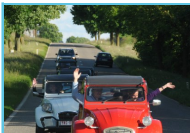
The Good Time Company