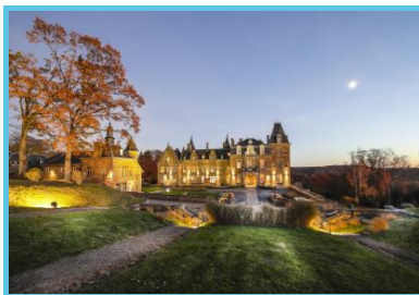
Château de la Poste