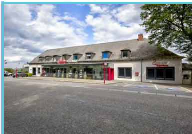
WBT - V. Ferooz - Pixel Komando