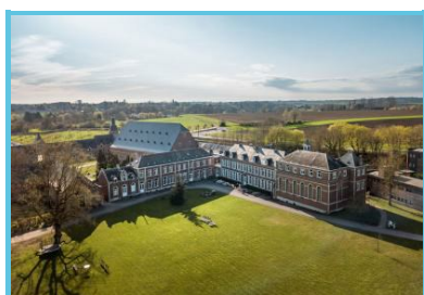
Fabien Barrau – Chateauform