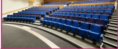
Hotel Dolce La Hulpe Brussels

Téléphone de contact : +32 2 290 98 00 Téléphone de réservation: +32 2 290 98 00